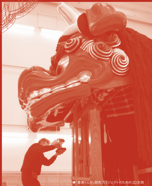
●「唐津くんち」研究プロジェクトのための3D計測

●主催/富山大学芸術文化学部附属 技藝院(文化財保存・新造形技術研究センター) ●協力/東横INN ●後援/北日本新聞社 ●問合せ/富山大学 五福高岡地区事務部 芸術系総務・学務課 地域連携担当(担当:山本) 〒933-8588 富山県高岡市二上町180番地 [TEL] 0766-25-9117 [E-mail] tiikiko@adm.u-toyama.ac.jp