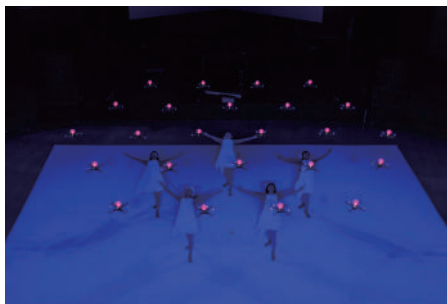
Rhizomatiks x ELEVENPLAY (24 drones) 2015年