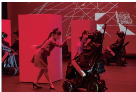
ELEVENPLAY x Rhizomatiks (border 2021) 2021年