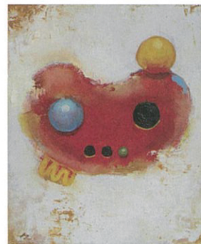
遊び心 (2019-1) 272×220mm May.2019 木製パネルに白亜地、油彩