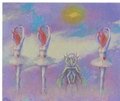
やむを得ないハーモニー (2019-1) 380×455mm July.2019 木製パネルにジェッソ、油彩

若手女性作家グループ展シリーズ Ascending Art Annual Vol.3「うたう命、うねる心」会場風景