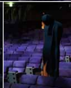
舞台の上の美術館Ⅱ「巨艦と虚無」