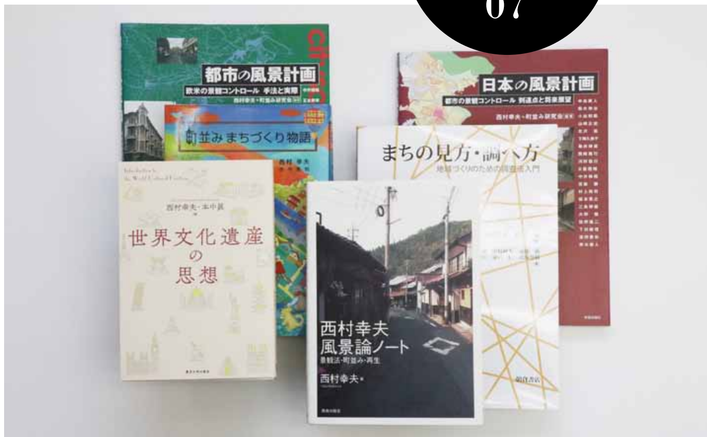
著作・編集を行った書籍の一部：『都市の風景計画』『日本の風景計画』『町並みまちづくり物語』『まちの見方・調べ方』『世界文化遺産の思想』『西村幸夫風景論ノート』