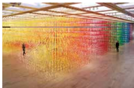
写真上：「巣鴨信用金庫志村支店(2011)、写真左：「数字の森」国立新美術館(2017)