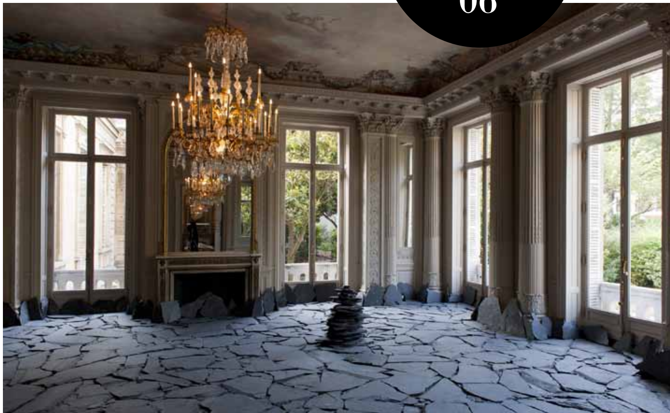
写真(2点共):「深みへ-日本の美意識を求めて」展(2018)